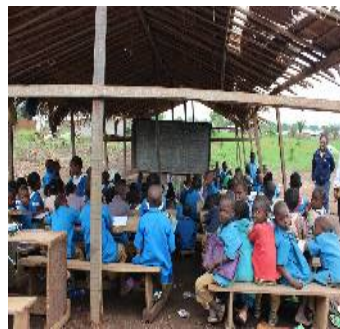
下:質の高い教育をみんなに