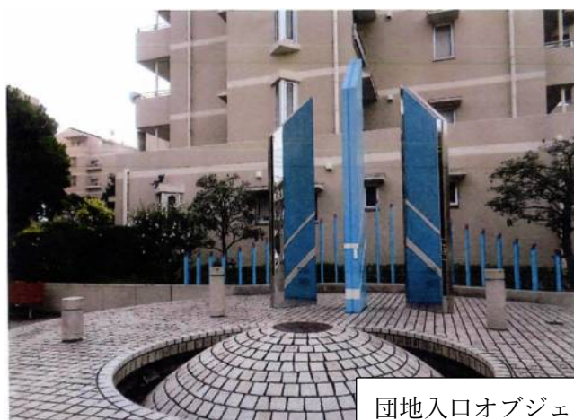
団地入口オブジェ