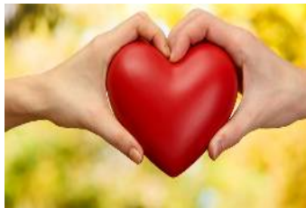
上:すべての人に健康と福祉を

すべての人が健康で、安心して暮らすためには、病気を未然に予防したり、適切な治療を受けたりすることが必要です。また、妊娠や出産の際に誰もが保健サービスを受けられること、幼い子どもが本来予防できるはずの病気で命を落とすことがないようにすること、そして誰もが薬やワクチンを手にできるようにすることが必要です。目標Ⅲでは、これらを達成するとともに、途上国で深刻な交通事故による死亡者・負傷者の数を半分に減らすこと、化学物質や大気・水質・土壌の汚染を減らしていくことも目指しています。