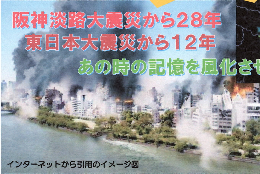
インターネットから引用のイメージ図