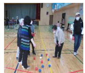
ボッチャの得点判

6月；ピンポン・ボッチャ他 5・7月；ピンポン・ボッチャ他及び 関口先生のおもしろ実験室