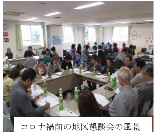
コロナ禍前の地区懇談会の風景

参加者；地区社協の委員・福祉委員、自治体の代表者、福祉施設関係者、教育関係者、医療関係者