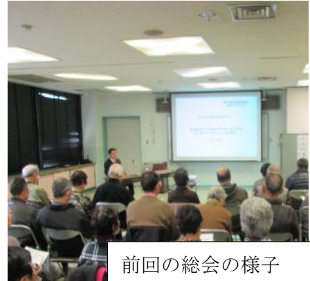
前回の総会の様子