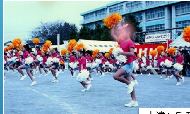
大津ヶ丘ふるさとまつり