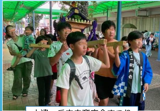
大津ヶ丘中央商店会まつり

みんなの未来に光を デジタルイルミネーション 光で結ぶ絆 2023 日時 2023年 1月20日(金曜日) 開場18時 開演18時30分 場所 大津ヶ丘第一小学校 校庭 ※雨天 1月23日(月曜日) 寒くなるので寒さ対策をしておきましょう