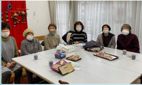
大津ヶ丘第一管理組合