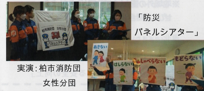
「防災 パネルシアター」 実演: 柏市消防団 女性分団