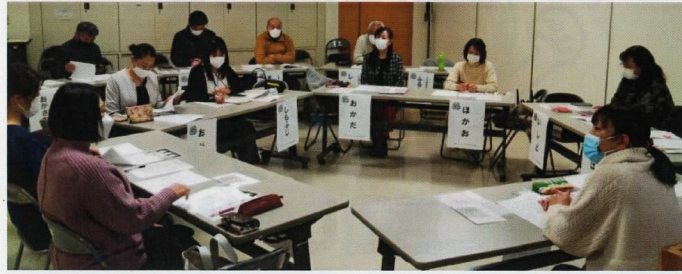
ジョイナスの集い 年4回程度実施