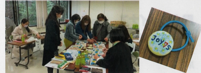
ジョイナスのスカーフ止め作り