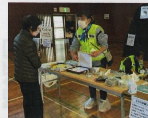
被災体験の講話や 地域避難訓練への協力