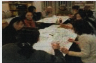
避難所運営訓練(HUG:ハグ)や 防災講習会への参加