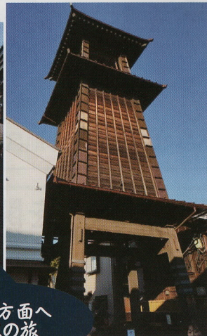
川越方面へ バスの旅