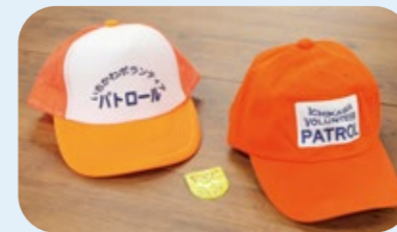
▲貸与している帽子(夏用・冬用)

ジョギングや犬の散歩、買い物など日常のちょっとした外出の際に、パトロール活動を兼ねてオレンジ色の帽子を身につけてもらうものです。